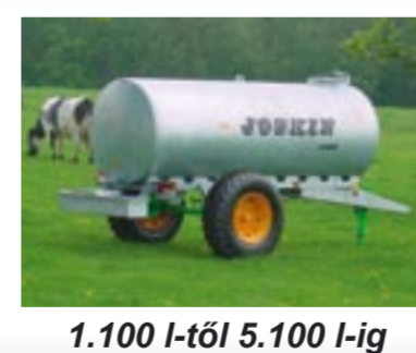
1.100 l-től 5.100 l-ig