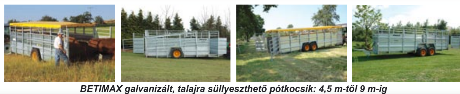
BETIMAX galvanizált, talajra süllyeszthető pótkocsik: 4,5 m-től 9 m-ig